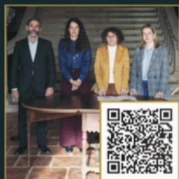
Simulacro do acto en Meirás

Materiais de acceso libre que permiten coñecer mellor o proceso creativo do Pórtico da Gloria, o periplo das estatuas até a súa devolución ao Concello de Santiago e a súa relevancia na cultura galega e europea.